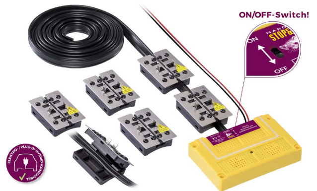
7 PLUS-MINUS CLIP Hochspannungsgerät mit Ultraschall